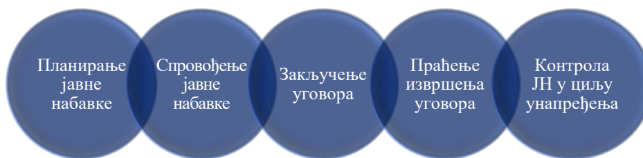
Фазе поступка ЈН

Први Закон о јавним набавкама донет је 2002. године. 20 У претходном двадесетогодишњем периоду било је измена и допуна прописа у области јавних набавки. Тренутно је на снази Закон о јавним набавкама 21 који је донет крајем 2019. године, а који је усвојен из потребе да се прописи о